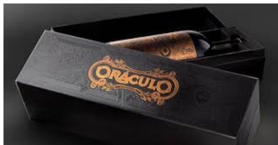
Oraculo D.O Ribeira del Duero Tinta del pais 24 Meses de Barrica 93 de Puntuacion