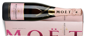
Moët et Chandon Rosé