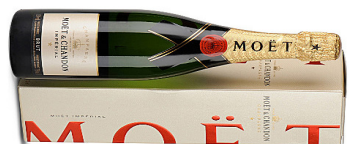
Moët et Chandon Brut