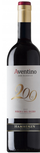
Aventino - 200 Bariles D.O. Ribera del Duero Cepas entre 80 y 120 años Crianza de 18 meses